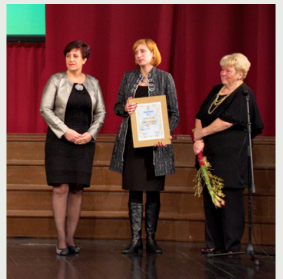
FOTO Prizadevanja Zasavske ljudske univerze za promocijo vseživljenjskega učenja in promocijo Trbovelj sta prepoznala tudi Občina Trbovlje in Turistično društvo Trbovlje in ZLU v letu 2017 podelila priznanje.