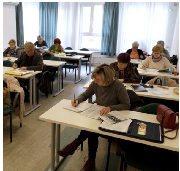
FOTO Prijetne učilnice so pogoj za dobro počutje udeležencev, zato smo največjo v zagorski Graščini lani prenovili.