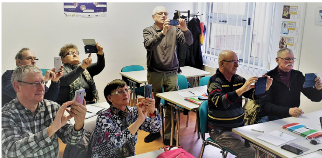
FOTO Iz delavnice uporabe pametnih telefonov v Trbovljah.

Središče za samostojno učenje je na voljo odraslim, ki potrebujejo miren prostor za učenje. Prav tako imajo tukaj možnost uporabe računalnika za izobraževalne namene.