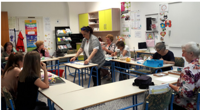
FOTO Tečaj slikanje za dušo

Naša najboljša prijateljica na štirih tačkah Ota vsak mesec razveseli stanovalce doma upokojencev v Šmartnem.