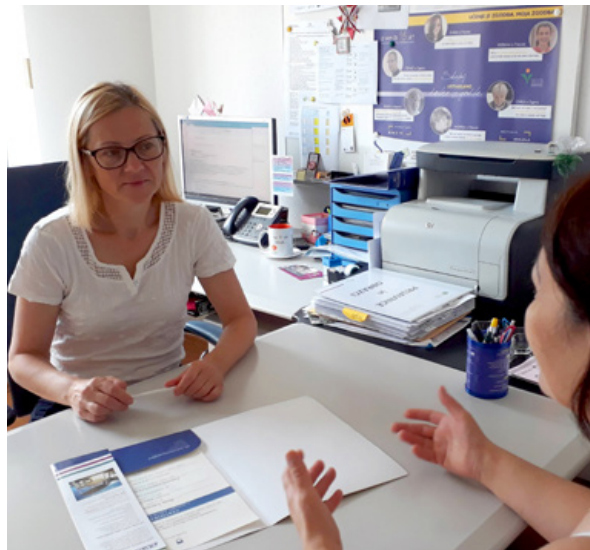
FOTO Svetovanje na ZLU je osebno, zaupno in brezplačno.