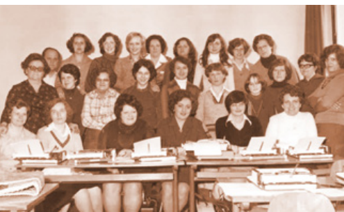
FOTO Udeleženske strojepisnega tečaja 1978

Zgodovinski pregled nam pokaže, da je Zasavska ljudska univerza vedno zaznala družbene spremembe in se znala odzvati na potrebe v lokalnem okolju. Vsa leta svojega delovanja je bila glavni vir izobraževanja odraslih. Na začetku je ponujala politično in strokovno izobraževanje, organizirala številna predavanja o aktualnih temah, se v šestdesetih letih prejšnjega stoletja preusmerila k strokovnosti in sistematičnosti v izobraževanju in povečala izbor tujih jezikov ter v ponudbo vključila nove oblike izobraževanja.