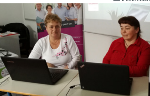
FOTO Dobra digitalna pismenost je pomembna tudi za kmete ...