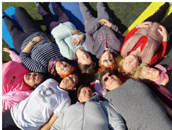
FOTO Udeleženke športne rekreacije za zdravje