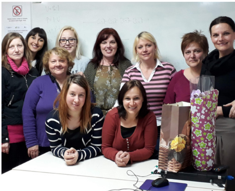
FOTO Udeleženke letošnjega programa NPK socialni oskrbovalec na domu so dobile zaposlitev v rekordno kratkem času.