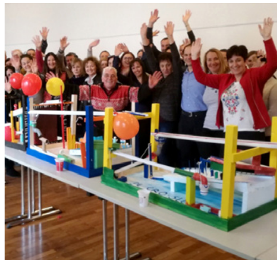
FOTO V lanskem decembru smo v Trbovljah uspešno izpeljali mednarodni projektni trening izdelave verižnih členov.