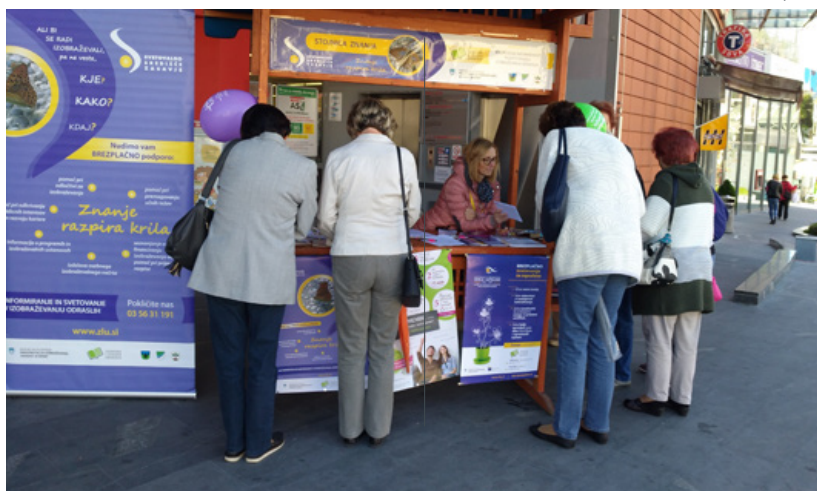
FOTO Stojnica znanja v okviru vseslovenskih dni svetovalnih središč ISIO

V okviru različnih aktivnosti nas lahko srečate po vsem Zasavju. 25. septembra na Stojnici znanja pred Sparom v Trbovljah in Zagorju, kjer nas lahko kaj vprašate ali si prisluzite darilce. Skozi vse leto pa nas boste lahko srečali tudi v svetovalnem kotičku, ki ga občasno pripravimo v dogovoru z Rdečim križem v Zagorju in Trbovljah. Če bi želeli svetovalni kotiček za vaše uporabnike, člane vašega društva, zaposlene v podjetju ... se z veseljem odzovemo vašemu povabilu.