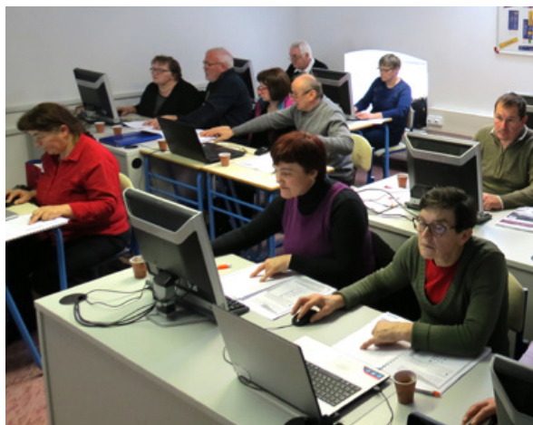
FOTO Iz računalniške učilnice